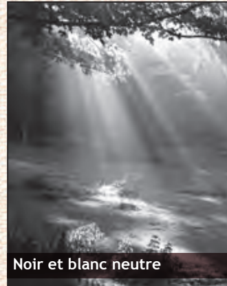
Noir et blanc neutre

Couleurs calibrées, noir et blanc neutre, noir et blanc chaud.